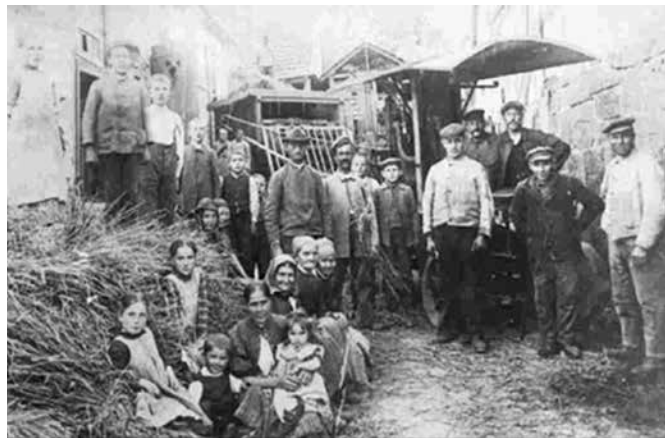
Großfamilie auf dem Land