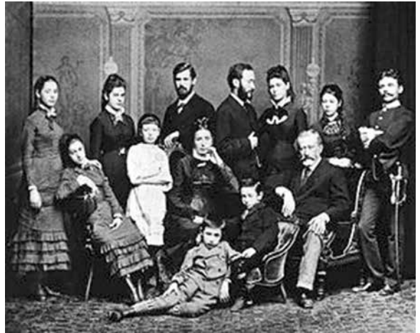
Großfamilie in der Stadt

Die Kinderarbeit war zur Existenzsicherung häufig nötig. Säuglinge konnten kaum beaufsichtigt werden, wenn die Eltern in den Fabriken waren. In den engen Wohnungen in den Städten wurden auch Betten an sogenannte „Schlafgänger“ vermietet, um einen Zuverdienst zu erhalten.