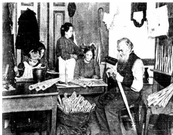
Eine Familie in Heimarbeit