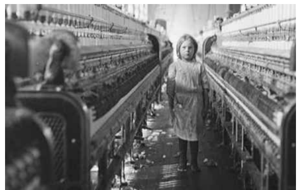
Kinderarbeit in einer Textilfabrik