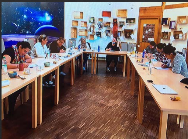
Workshop in der Lenzsiedlung