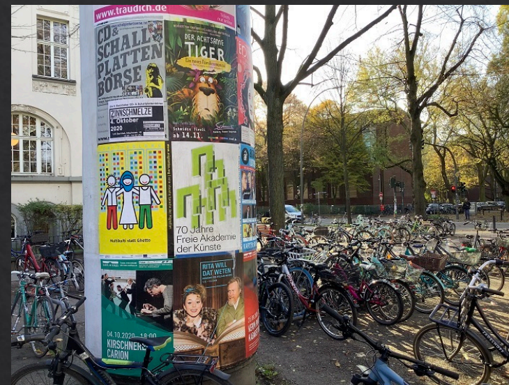
alle Piktogramme: migrantas : www.migrantas.org